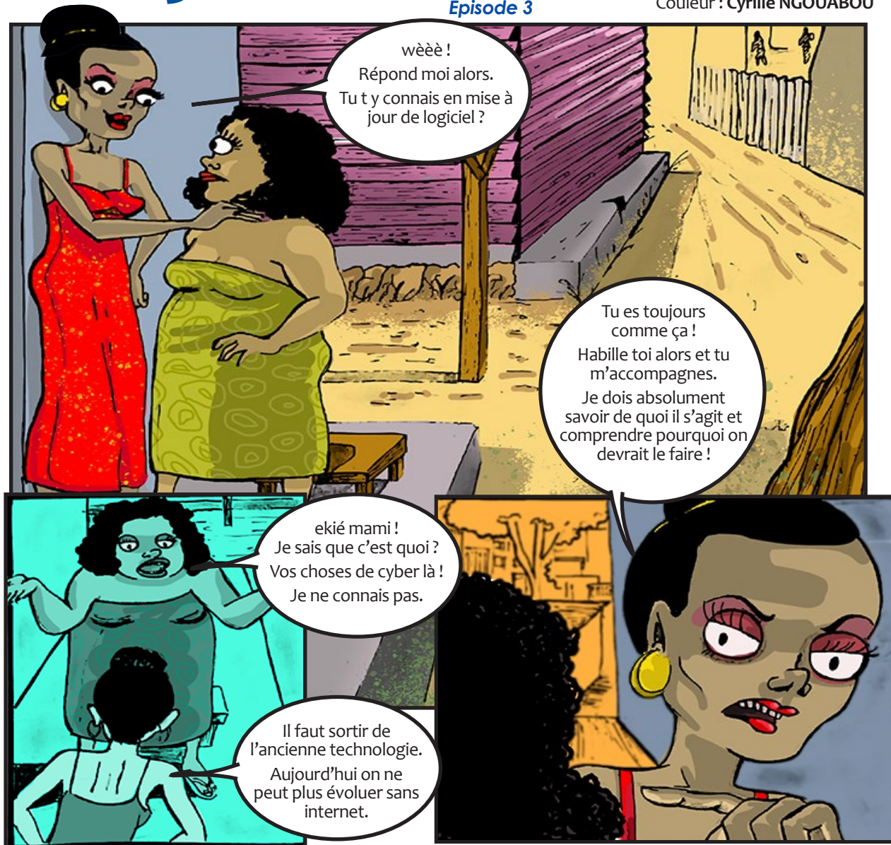
Illustration : Loïc NSI (stagiaire) Couleur : Cyrille NGOUABOU